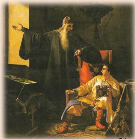
Иван IV и иерей Сильвестр во время большого московского пожара. Художник Ф. Плешаков

После разрыва с Сильвестром Грозный стал смотреть новыми глазами на учителя и его пророчества. В первом письме Курбскому он писал: «не мните мя детскими страшилы (выдумками Сильвестра. — Р. С.), устрашити, яко же прежде того с попом Селивестром и со Алексеем (Адашевым. — Р. С.) лукавым советом прельстисте мя». Мысль о том, что Сильвестр, пугая ученика вымыслами, считал его человеком умственно ущербным, «младенчествующим разумом», казалась царю несравненно более обидной, чем любые обвинения в кровопийстве и пр.