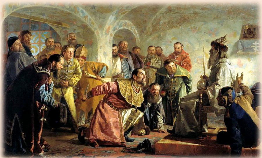
«Опричники» Худ. Н. Неврев

Опричниной называлась часть страны, которую царь в это время взял под личный контроль (слово произошло от древнерусского опричь, что значит «отдельно», «кроме», «за пределами»), а опричниками – личная «гвардия» царя, которая уничтожала его предполагаемых противников и отличалась особой жестокостью.