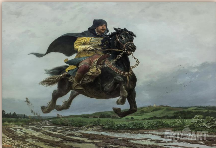
Опричник XVI век. Худ. С. Ефошкин

Суть такой политики состояла в выделении части земли для нужд государства и его служащих, а смысл – в отделении «добрых семян православной соборности» от «плевел еретических мудрствований, чужебесия в нравах».