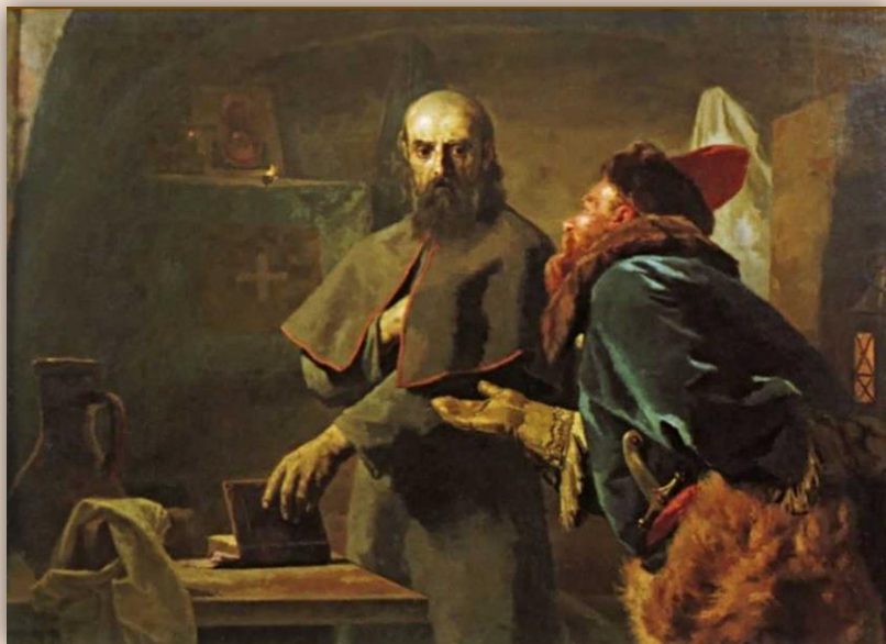
«Митрополит Филипп и Малюта Скуратов» Худ. Н. Неврев

В том самом монастыре военный деятель и любимый опричник Грозного Малюта Скуратов задушил Филиппа за отказ благословить военный поход на Великий Новгород.