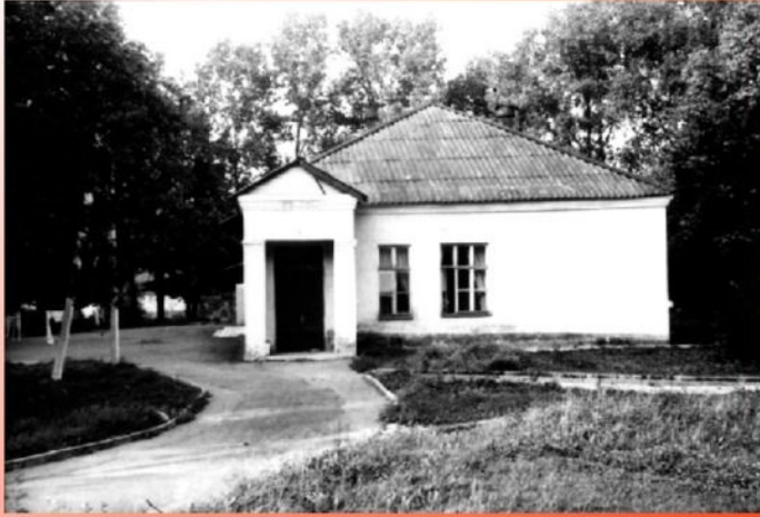
Вязьма. Больница (ныне - железнодорожная), где работал М. Булгаков. Сохранившийся корпус начала XX в. 1980-е годы.